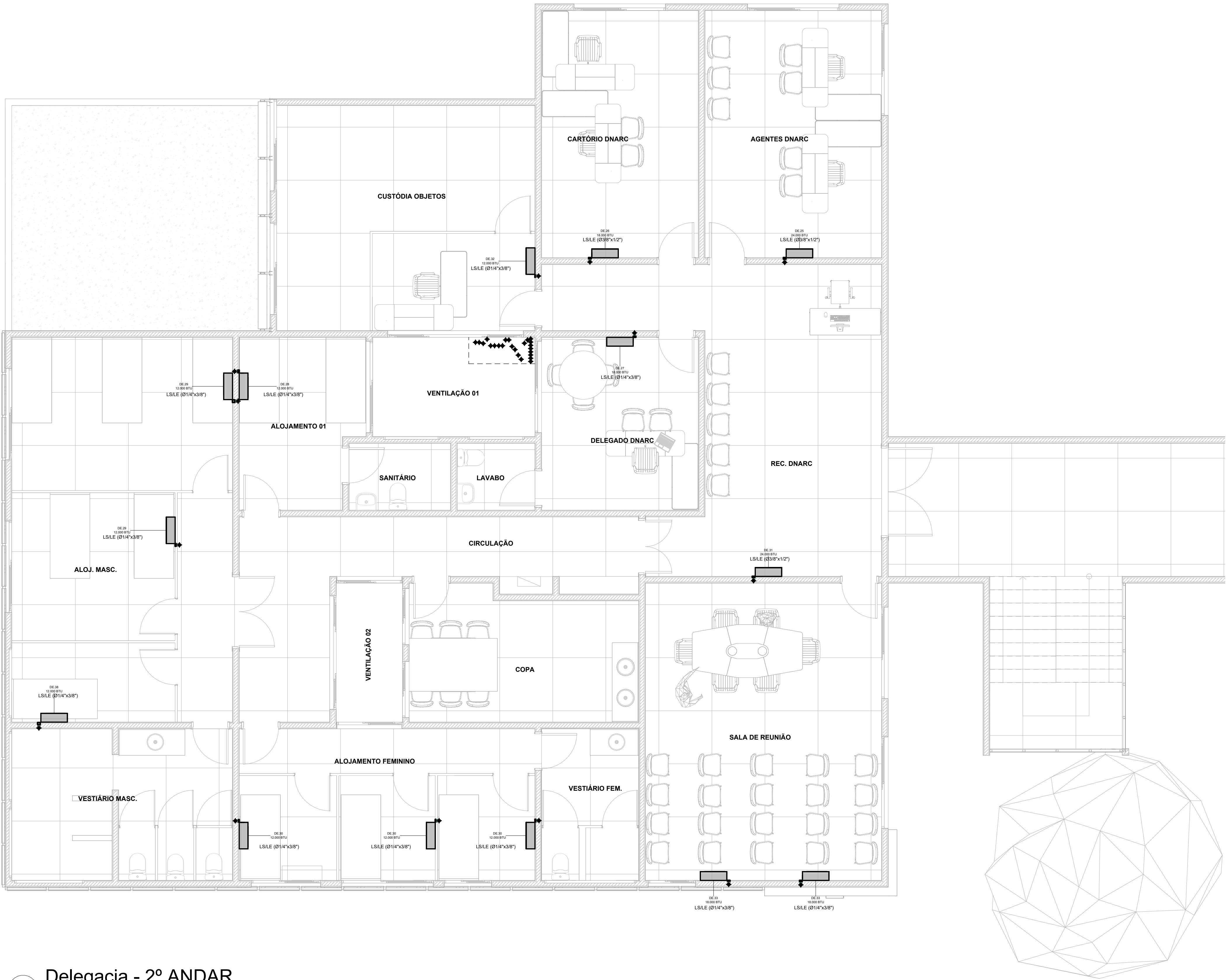
1 Delegacia - 2º ANDAR 1 : 50